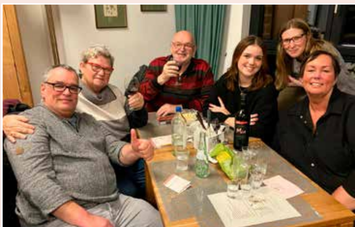
Die Gewinner vom letzten Mal!

An dieser Stelle ein Beitrag der Canasta-Gruppe, die am letzten Quiz teilgenommen hat: